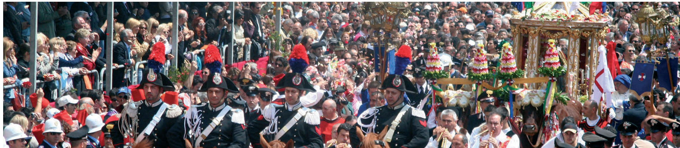
CORTEO SANT'EFISIO